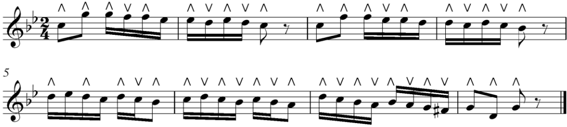
شكل رقم (٧) التدريب الثاني لتذليل الصعوبة الثانية

- التدريب الثاني لتذليل الصعوبة الثانية: